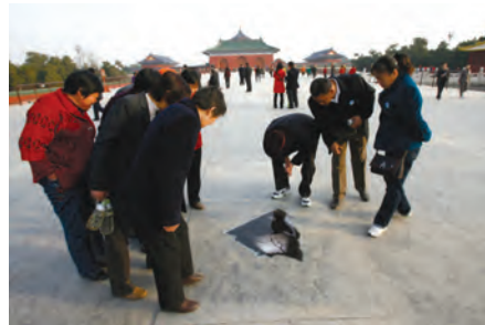
2009年3月22日，北京市民正在关注绿色和平的“积水坑”，以了解更多中国水污染问题。

2009年3月21日，北京的一些地面上忽然出现了一种半米见方的“积水坑”，倒影着一个正在捧水喝的孩子。原来，这是国际环保组织绿色和平在3月22日世界水日前的宣传贴纸，贴纸上写着“有四分之一的中国人正在喝不安全的水”。绿色和平期望以这种特殊的活动形式，把中国正在面临的严重的水污染问题直接带到了人们面前。