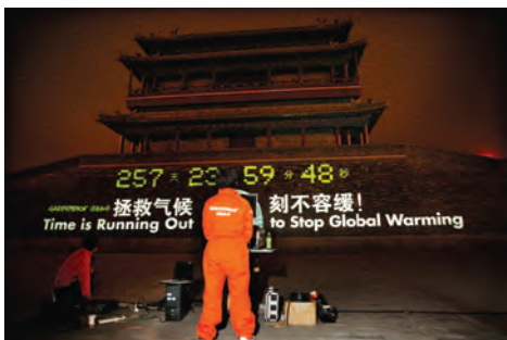
2009年3月23日，国际环保组织绿色和平在北京的永定门启动了拯救气候倒计时的活动，“拯救气候，刻不容缓”的字样格外醒目。

夜幕下的永定门城楼上，高8米、宽42米的城墙面变成了倒计时钟，“拯救气候，刻不容缓”的字样格外醒目，一个巨大的计时器正在分秒倒数，寓意气候危机的倒计时已经开始。“我们正身处一个前所未有的环境危机当中，全球变暖的趋势已经加速并正在滑向失控的边缘。”绿色和平气候能源项目主任李雁说，“只有各国领导人携手行动，