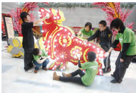
2009年2月8日，绿色和平在北京中关村购物广场展出了一组别致的花灯：由节能灯构成一个公牛，对比白炽灯做成的老鼠，希望能借此机会呼吁中国政府出台相关政策，让白炽灯尽早成为历史。

日前，中国有关部门正酝酿推出淘汰白炽灯的时间表，绿色和平十分支持政府的这项节能减排的工作，并希望相关政策能在2009年出台，将全面淘汰白炽灯列入第十二个五年计划中。