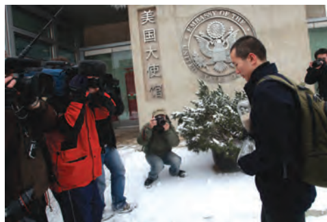
2009年2月，绿色和平通过美国大使馆给希拉里国务卿送上了一个玻璃沙漏作为其访华礼物，上刻“时不我待，拯救气候就现在”，表明对美国政府的愿望。

绿色和平认为：美国等发达国家需要更迅速地减少碳排放量，至少到2020年要比1990年的水准低40%——才能避免全球变暖的最严峻后果。