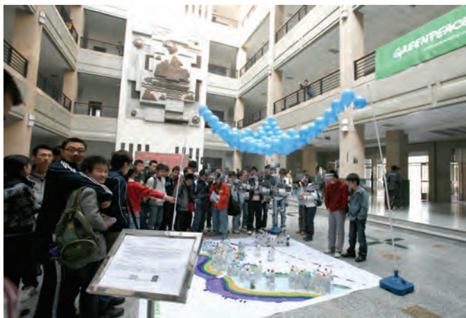
2008年10月31日，“我的城市，我的河流——绿色和平”沈阳环境信息立体地图”展览在东北大学开幕。

2008年底，名为“我的城市，我的河流”的“沈阳环境信息立体地图”展览在东北大学开幕。此“立体地图”由15名绿色和平沈阳大学生志愿者沿浑河两岸一路采集的水样组成，为全国首个城市环境信息立体地图。绿色和平志愿者说：“我们考察了浑河等市内主要水系，收集沈阳本地水样200余瓶，并沿途记录了空气、土壤的情况，考察周围社区的居民生存环境，拍摄照片资料。这个立体地图就是为大家还原一个由重要环境信息组成的沈阳。”此地图还在辽宁大学、沈阳航空工业学院、沈阳化工学院、沈阳建筑大学等院校展出。