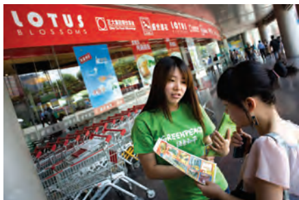
2009年5月23日：绿色和平要求易初莲花等大型连锁超市承诺提供“无农药，无转基因”的蔬果产品，同时提请消费者警惕超市所售新鲜蔬菜水果的农药残留和转基因问题。

绿色和平以三口之家一天所需量为标准，在北京、上海和广州的易初莲花购物中心、沃尔玛超市、华润万家超市、农工商超市，以及两个农贸市场，购买了当地常见的蔬菜和水果进行检测。检测结果显示，多种农药混合使用的情况非常严重，还检出少量违禁高毒农药。例如在某超市的一颗草莓和另一超市的一根黄瓜上分别检