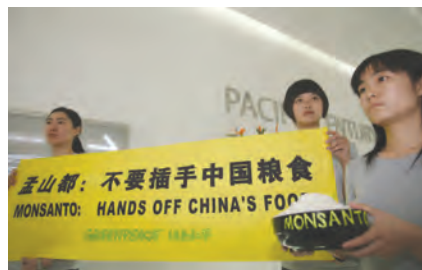
2009年4月28日，绿色和平成员在跨国生物技术公司孟山都的办公室前展示“孟山都：不要插手中国粮食！”的横幅，要求孟山都、杜邦、拜耳和先正达等国外生物公司，停止垄断稻米基因专利、侵犯中国粮食主权的行径。

如分子标记辅助育种和生态水稻种植方法等。这样才能真正保持农业稳定发展的同时保障我国的粮食安全。