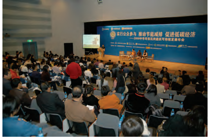
2008年10月31日，绿色和平行动统筹钟峪在大会上分享绿色和平转型的思考。

在讨论中，自然之友和阿拉善也提出了各自组织在发展过程中所面临的转型需求和思考。不仅是国际NGO需要转型，中国本土的NGO也正在不断调整。转型虽然是一个艰辛的过程，但是我们相信，基于合作的理念、开放的心态和务实的行动，绿色和平能更切实地为中国的环境问题提供可持续的解决方案。