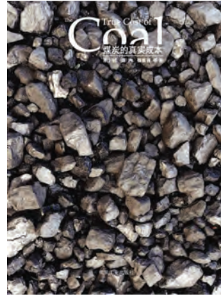
2008年10月27日，绿色和平、能源基金会与世界自然基金会共同发布《煤炭的真实成本》研究报告。

我国每使用一吨煤，就带来150元的环境损失。二氧化碳是导致气候变化的最主要温室气体，而中国每年80%的二氧化碳排放量来自燃煤。