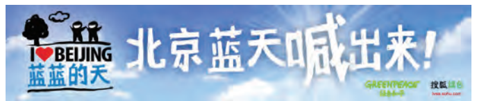
2008年9月，绿色和平与搜狐绿色频道合作，举办“北京蓝天，喊出来”活动。

因此，绿色和平与搜狐绿色频道合作，举办“北京蓝天，喊出来”活动，并将网友的呼声反应给北京市环保局，希望北京的蓝天能够继续，此次活动得到四万多名网友的关注。