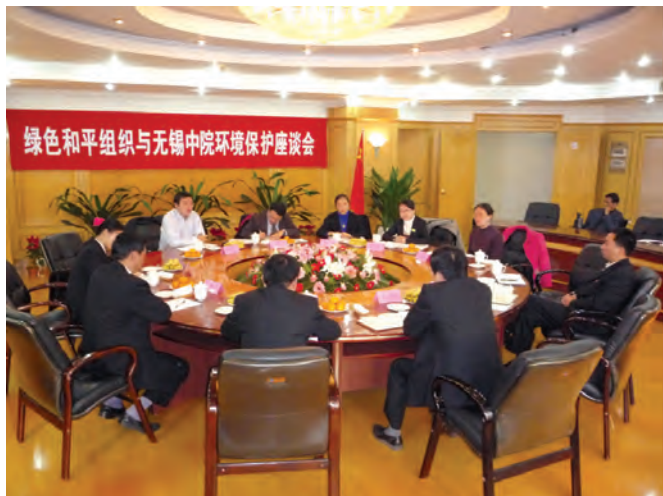
2008年12月2日，绿色和平与无锡市中级人民法院座谈

2008年12月初，绿色和平一行先后前往江苏省的南京、无锡市，考察美丽江南太湖明珠的环境状况。