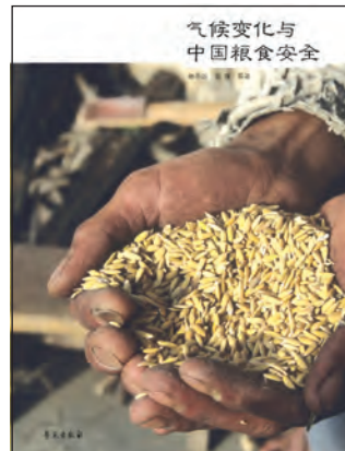
2008年10月15日，绿色和平发布《气候变化与中国粮食安全》的研究报告。

绿色和平的实地调查同样显示：在虫害、雪灾、旱灾等自然灾害面前，稻鸭工作、多样性种植、保护性耕作等生态农业模式具有更强的应对能力。