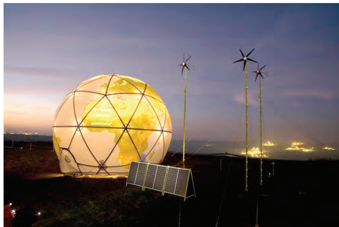
2008年12月，绿色和平在联合国气候大会会场附近建造的气候拯救站，整个地球形状营地的电力全部来自于风能、太阳能等可再生能源。

握别的时候，戈尔说：“继续你们在中国的工作吧。加油！”这是一份对整个绿色和平中国办公室的鼓励。